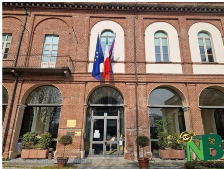
Progetto C.I.V.I.C: Biella e Amfikleia-Elateia stringono il gemellaggio.

In questi giorni è stato sottoscritto il Grant Agreement tra la Provincia di Biella e la Commissione Europea per la realizzazione del progetto "C.I.V.I.C. - EnhancIng good local goVernance for solidarity and inClusion".